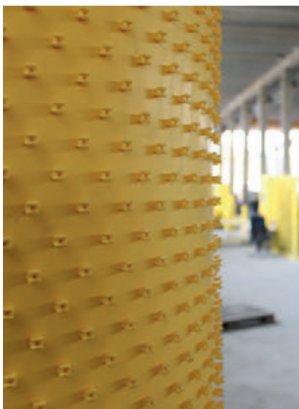
Прочное соединение футеровки с бетонной трубой обеспечивается за счет многочисленных маленьких анкеров на обратной стороне

На заводе Grafe Beton производство ведется вертикальным способом, то есть закрытая форма для трубы заполняется сверху бетонной смесью. После набора