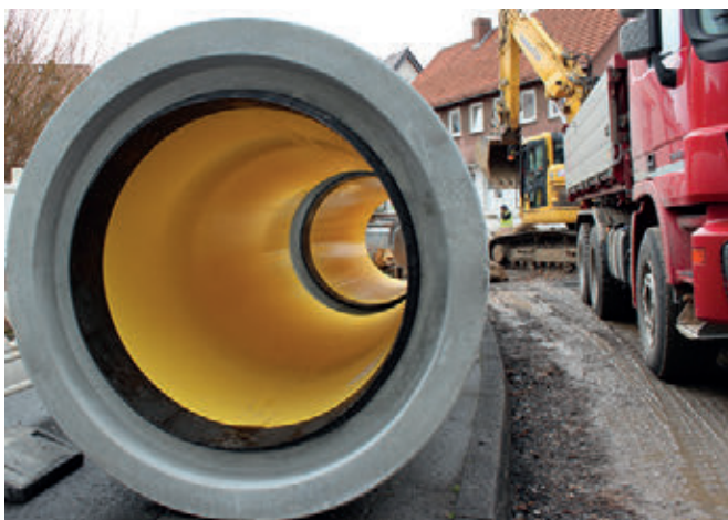
Промежуточный склад железобетонных труб DN1000 Perfect Pipe с интегрированным штекерным соединителем на строительной площадке в Зандерхаузене, коммуна Нистеталь

футеровкой. Ремонтируемый участок канализационной системы составляет в длину 300 м, при этом монтаж труб ведется методом открытой траншейной укладки. Помимо труб монтажной длиной 3 м, также используются более короткие фасонные трубы, также облицованные высокоплотным пластиком, и шесть колец с днищами Perfect выпуска завода Tamara Grafe Beton. Новая канализационная ветка отличается повышенной пропускной способностью, стойкостью к коррозии и высокой статической несущей способностью. В связи с довольно каменистым грунтом и высоким риском повреждения элементов процесс