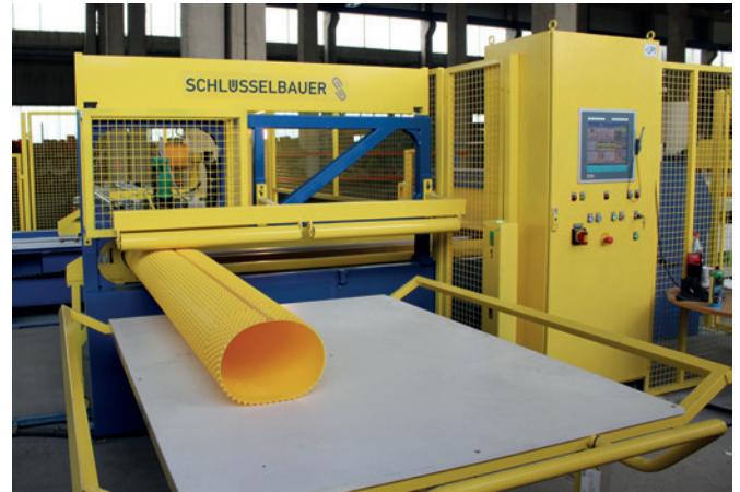
Сварочный робот собственной разработки фирмы Schlüsselbauer прочно и надежно сваривает футеровочный вкладыш в цилиндр

бования к качеству выпускаемой продукции передаются из поколения в поколение. Компанию отличают стремление к внедрению инновационных разработок, творческий подход и гарантированно высокое качество продукции и услуг. Предприятие является востребованным партнером компаний, представляющих различные отрасли. Доверие клиентов и многочисленные премии и награды – лучшее тому свидетельство.