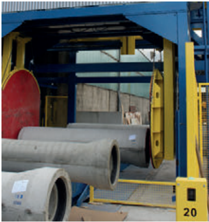
Проверка труб на герметичность

прочности форму открывают и извлекают трубу, снимая ее со сжимающегося сердечника. Формы состоят из двух половинок, которые перемещаются по специальным рельсам, неподвижно смонтированным на несущей опоре.