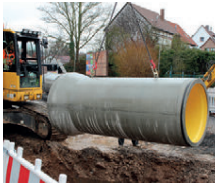
Укладка трубы в траншею при помощи цепных строп