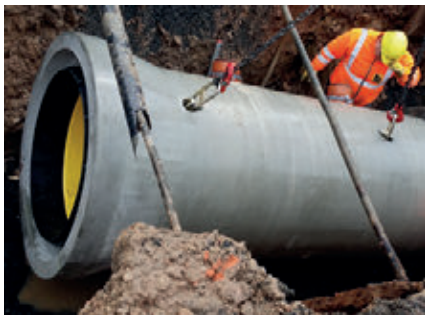
Осторожное опускание трубы и стыковка с уложенным участком канализационной сети