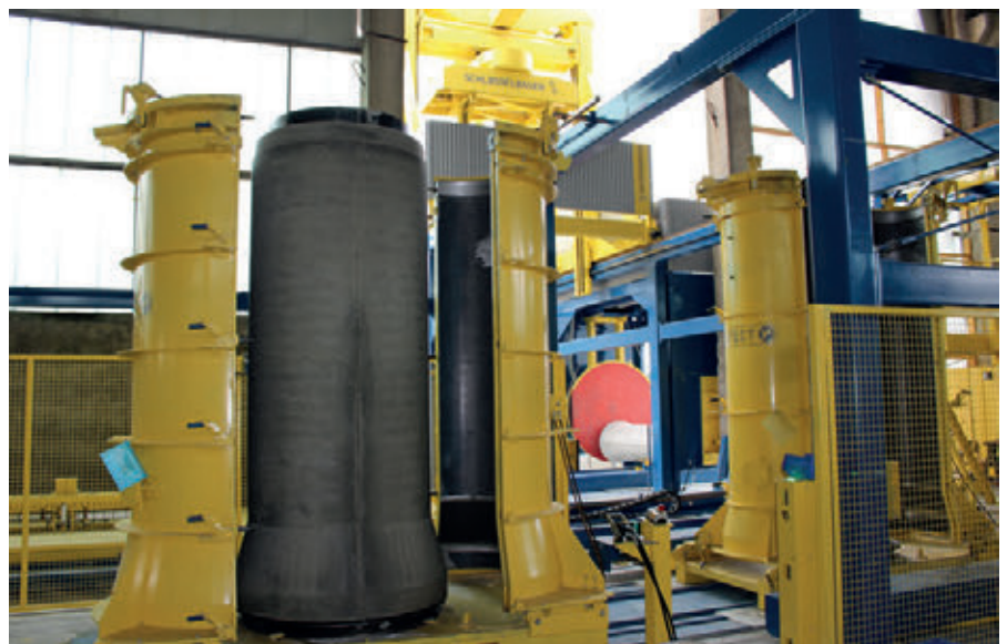
Робот с универсальным захватом для труб всех диаметров осторожно поднимает изделие за сердечник