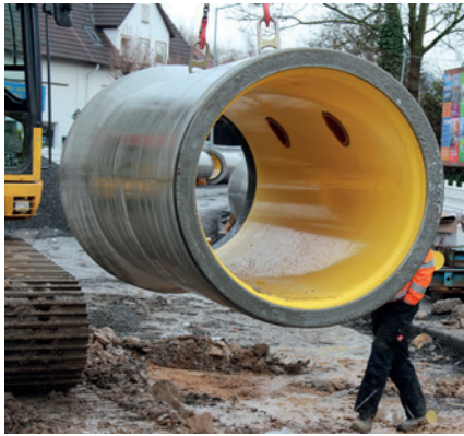
Подъем готовой к укладке трубы Perfect Pipe с двумя боковыми приточными отверстиями