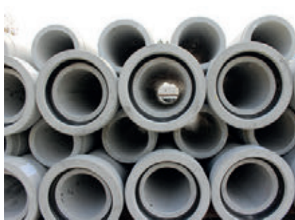
Бетонные трубы Perfect Pipe с встроенным уплотнением

замены старых канализационных труб создавал определенные сложности, которые были разрешены благодаря быстрому монтажу труб Perfect Pipe. Кроме того, рабочие на стройплощадке высоко оценили качество и продуманную конструкцию труб, упрощающую работы по их погрузке и разгрузке. Соединение труб выполняется легко и