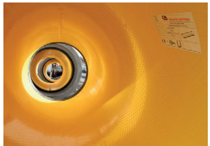
Футеровка из коррозионностойкого полиэтилена высокой плотности отличается надежностью и стойкостью к воздействию агрессивной химической среды